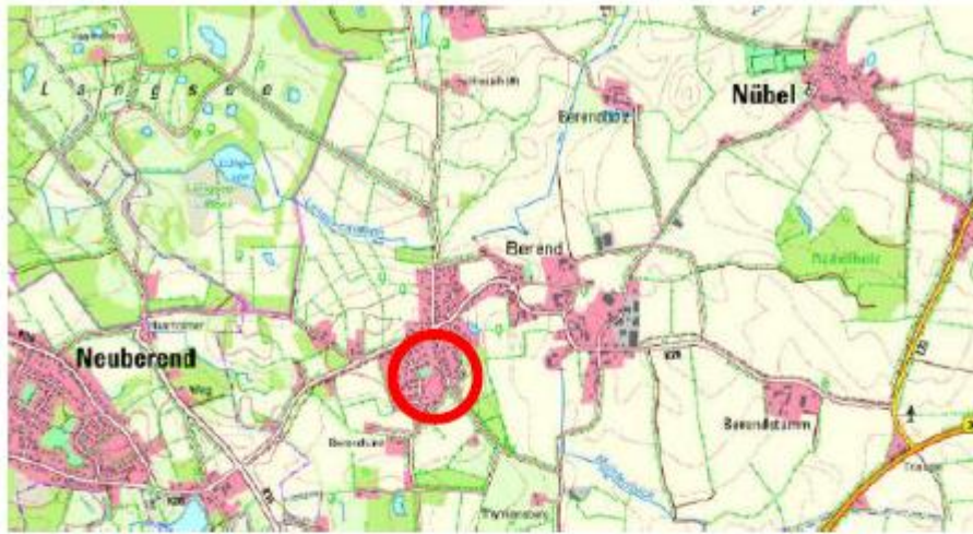
Lageplan (ohne Maßstab)